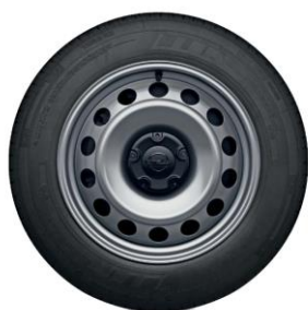
15" / 16" ocelové disky