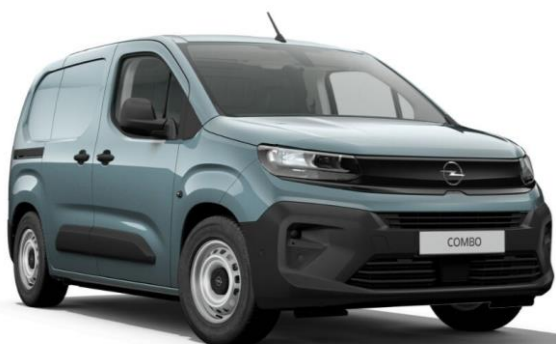
Modrá Kiama (M6M0) 450 €