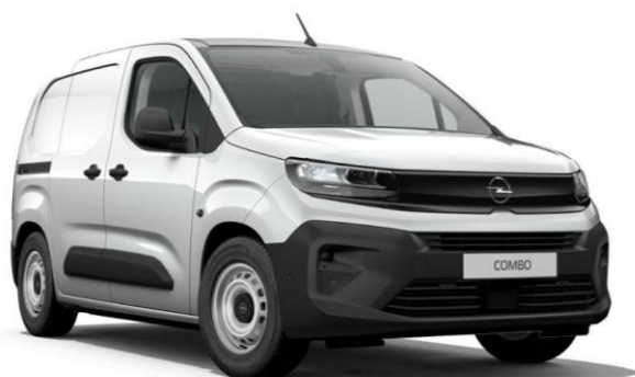
Šedá Kontrast (F4M0) 450 €