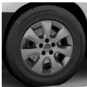
16" disky z ľahkej zliatiny (DZSD) 680 €