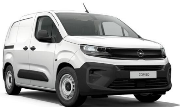
Biela Kaolin (PRPO) 0 €