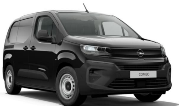
Čierna Karbon (9VM0) 460 €